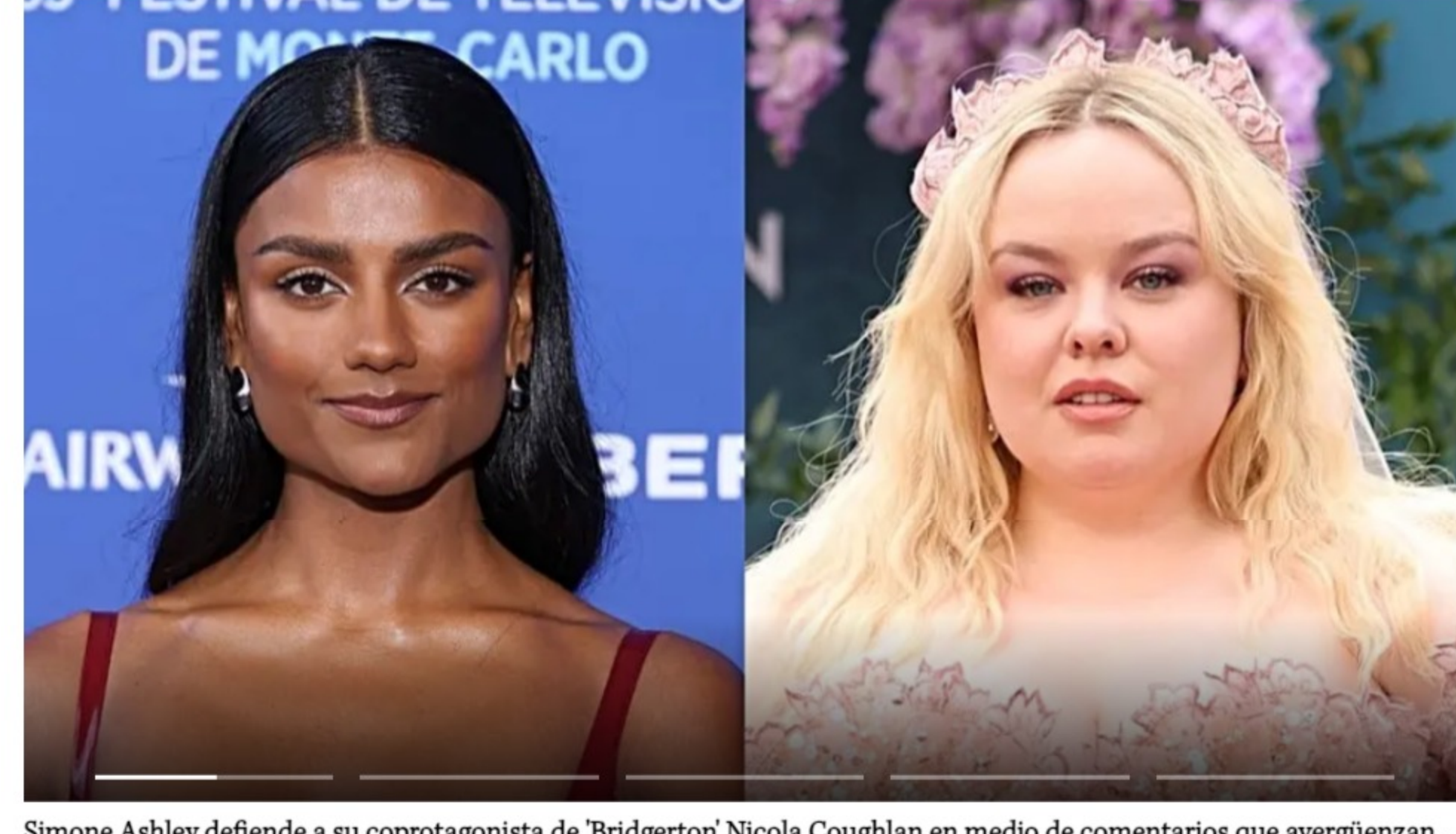
Simone Ashley defiende a su coprotagonista de 'Bridgerton' Nicola Coughlan en medio de comentarios que avergüenzan...