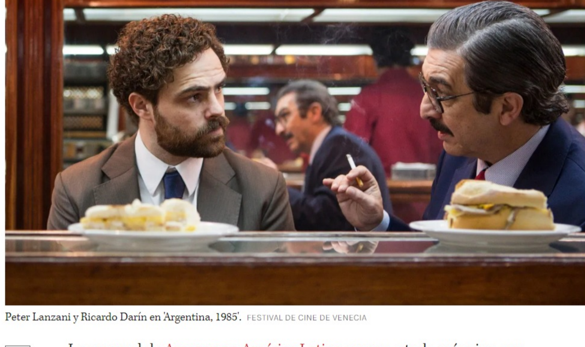
Peter Lanzani y Ricardo Darín en Argentina, 1985'. FESTIVAL DE CINE DE VENEZIA