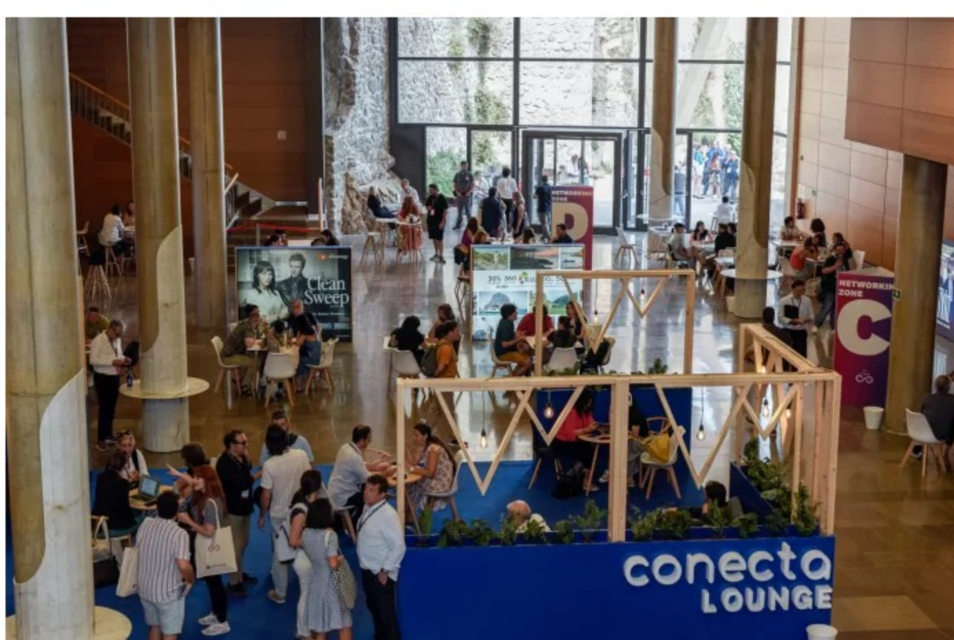
Conecta 2023

Conecta Fiction & Entertainment es un mercado profesional que tiene como objetivo promover el intercambio y la internacionalización entre profesionales del sector audiovisual para la creación, financiación, producción, transmisión y distribución de contenidos televisivos de ficción y entretenimiento de América y Europa. Su octava edición, prevista para el periodo del 18 al 21 de junio de 2024 en Toledo, España, tendrá a Brasil y Portugal como países destacados. La inscripción ya está abierta .